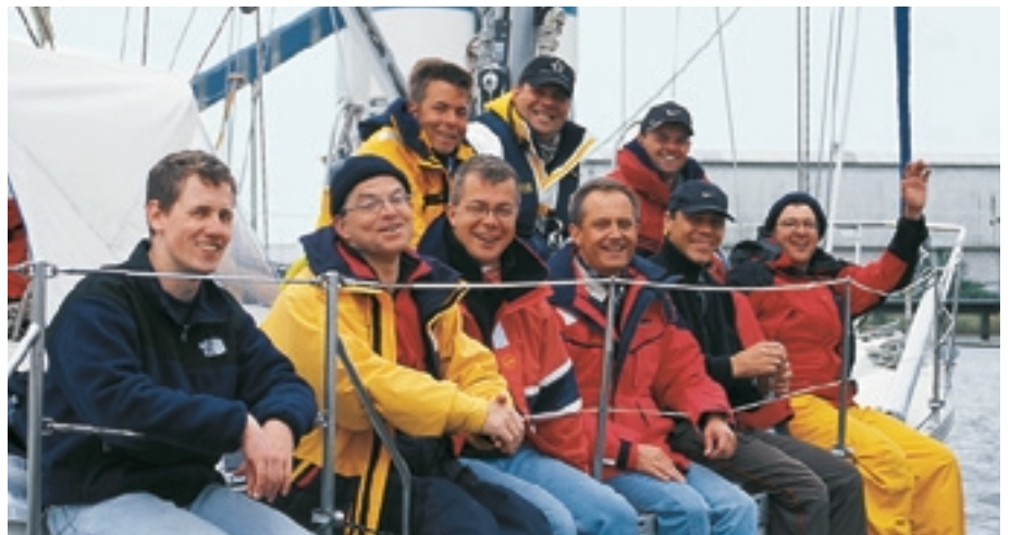
Erleichterung nach bestandener Prüfung: die frisch gebackenen SKS-Schein-Inhaber

Noch zerknirscht wegen der schlechten Manöver wird die Besatzung plötzlich