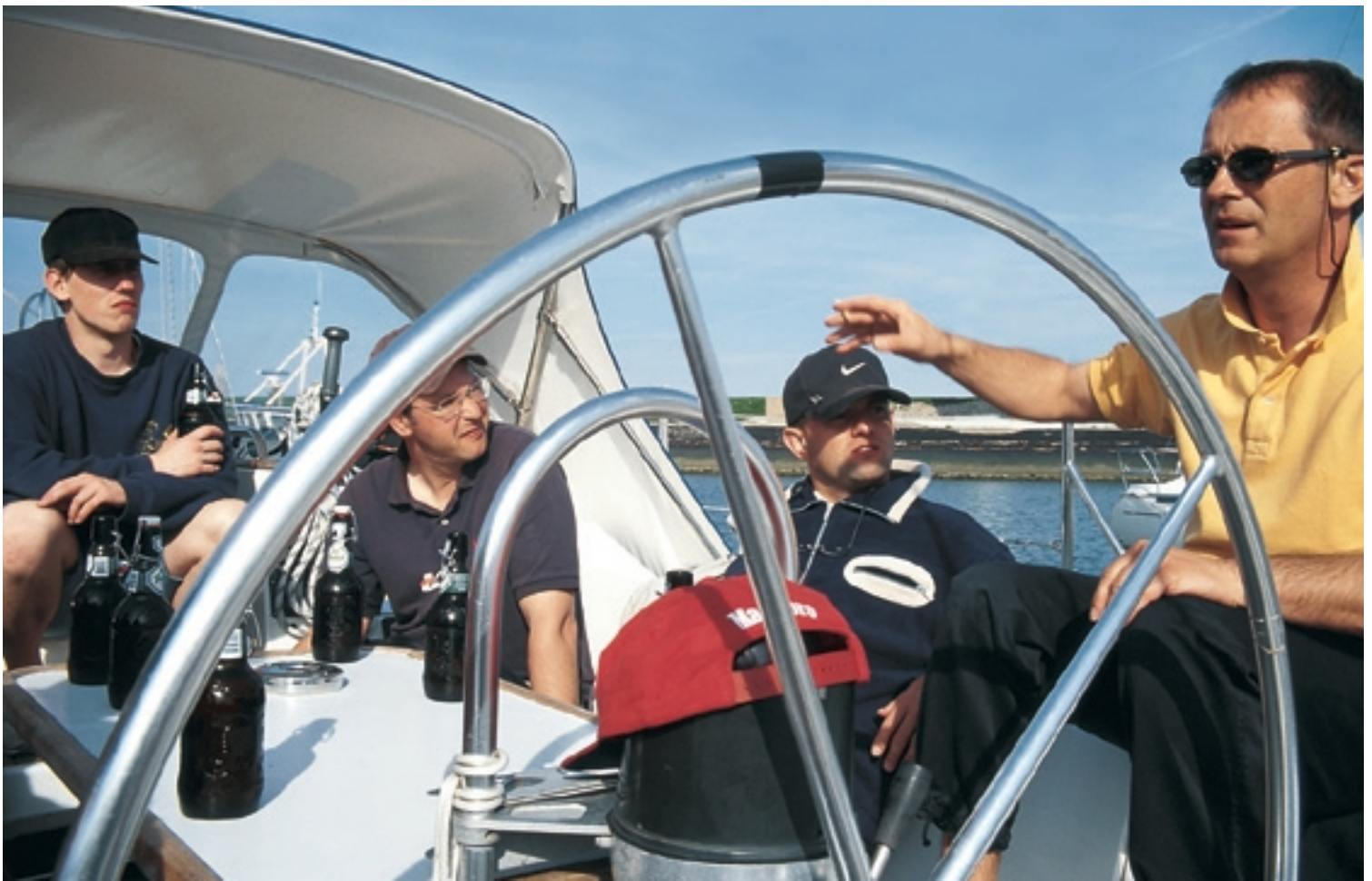
Letzte Instruktionen: Am Tag vor der Prüfung werden alle Manöver noch einmal besprochen, gibt der Skipper letzte wertvolle Tipps

nächste Runde. „Sch...“, denkt die Crew und schmeißt sich zum x-ten Mal in die Schoten. Die Feuchtigkeit, die den Männern an den Winschen den Rücken herunterläuft, ist alles, nur kein Regen.