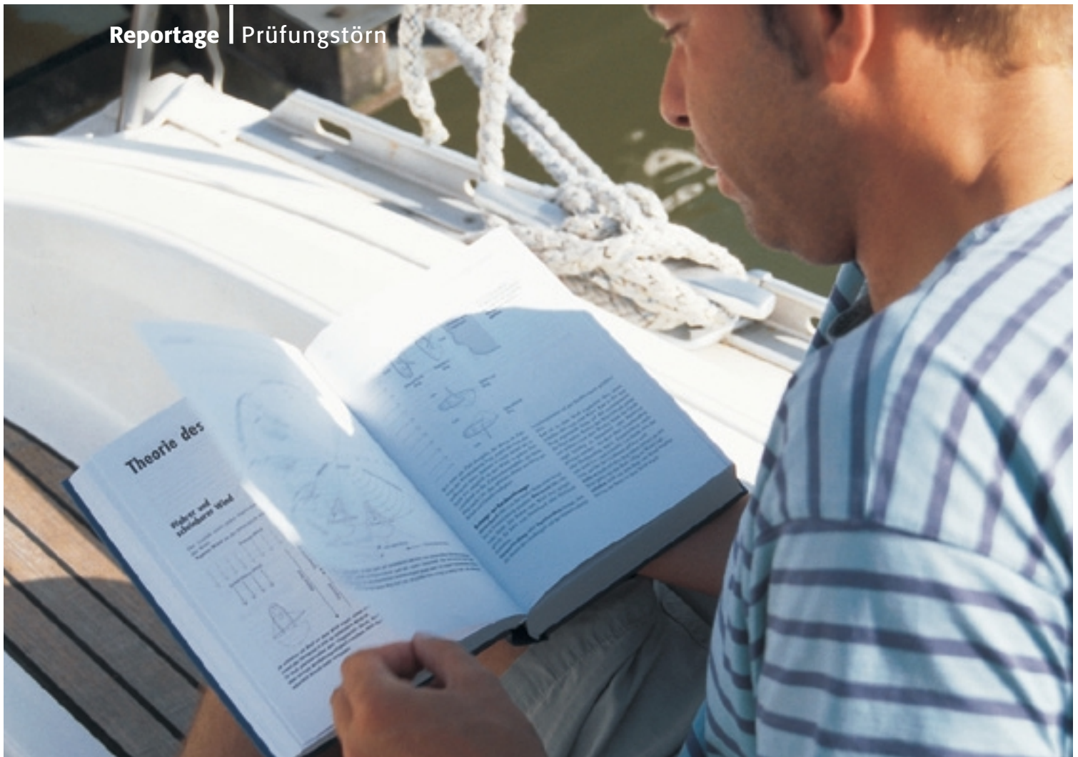
Ständiger Begleiter der Prüflinge: das Segellehrbuch. Hierin finden sich die Anleitungen, die es in die Praxis umzusetzen gilt

A ll ships, all ships, all ships!“ Lautstark krächzend beendet das Funkgerät eine viel zu kurze Nacht. Kopf an Kopf drängt sich eine Hand voll unrasierter Gesichter um den Navitisch. Gespannte Stille herrscht, als der Wetterbericht verlesen wird. Zuerst auf Englisch, dann auf Niederländisch. Für ungeübte Zuhörer so aufschlussreich wie eine Speisekarte auf Mandarin.