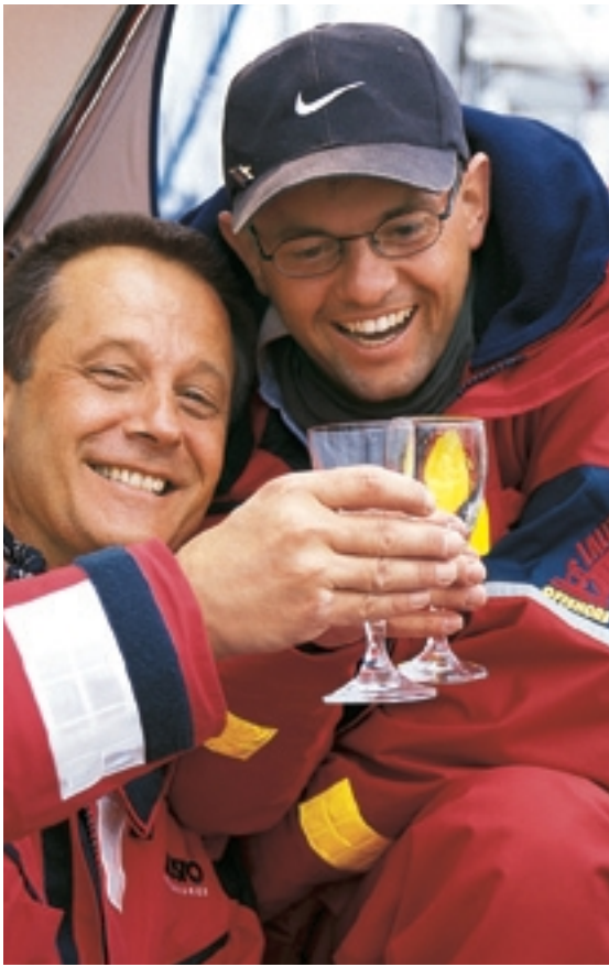
Geschafft! Auf den Erfolg wird mit einem Glas Sekt angestoßen, oder zwei, oder drei

einem kleinen Fragezeichen versehen sagen. „Klar, die Lee-Seite, ’türlich“, sagt der Prüfer.